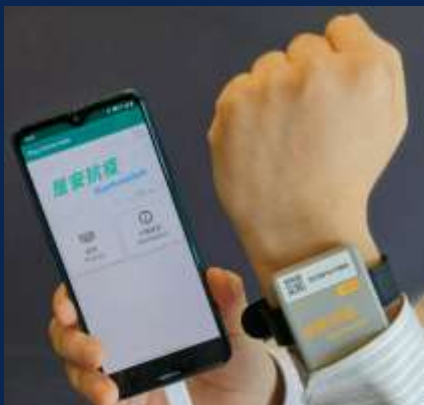
「居安抗疫」流动应用程序与 低功耗蓝牙电子手环