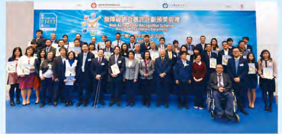
首屆嘉許計劃金獎得獎機構合照

自 2012 年 10 月起，政府資訊科技總監辦公室與平等機會委員會合辦「無障礙網頁嘉許計劃」，推動更多企業和機構建立無障礙網站，讓所有人都可方便地獲取網上資訊和使用網上服務。計劃設有金獎及銀獎級別，符合認可準則的網站，均可展示嘉許標誌，藉此表揚機構採用無障礙網頁設計的成就和建構關懷共融社會所作出的貢獻。