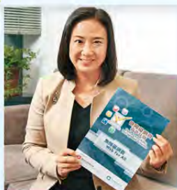
立法會議員 葛珮帆

“互聯網開拓了全新的世界，所有資訊、知識唾手可得，搵工和學習機會都可在網上找到。對殘疾人士來說，如果他們不能追上時代、不能上網的話，便會貧者愈貧，損失很多學習、工作、創業及方便生活的機會。以前推動無障礙網頁困難重重，現在由政府牽頭，相信會有好效果。”