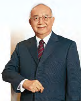
政府資訊科技總監 賴錫璋

首屆「無障礙網頁嘉許計劃」反應非常踴躍，有超過 100 間機構參與。頒獎典禮於 2013 年 4 月 15 日舉行，共 70 個網站獲獎，包括 44 個金獎和 26 個銀獎，得獎機構橫跨公共交通、電訊、新聞、銀行、醫療、學術、資訊科技、公營機構及社福機構等不同界別。他們採用優越的網站設計，令所有人士都能閱覽網站內容和使用網上服務，盡顯心思，實在值得嘉許。