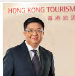
香港旅遊發展局 總幹事 劉鎮漢

“旅發局網頁除了加入無障礙設計，方便有需要人士瀏覽網頁外，還進一步加強內容，細心地在網站中列出香港各酒店、交通和景點等的無障礙設施，方便他們計劃行程，到港旅遊時，自然玩得更開心。”