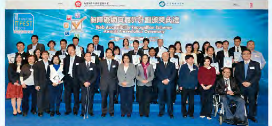
首屆嘉許計劃銀獎得獎機構合照