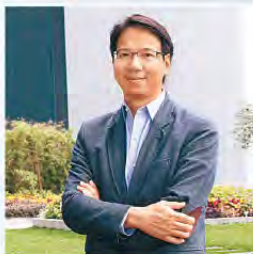
立法會 (資訊科技界) 議員 莫乃光

“每個人都有自己的權利，不論性別、一般人士或殘疾人士，儘管條件不同，都有權擁有自己的職業、社交、娛樂和文化生活。使用互聯網已成所有人士生活中不能或缺的一部分。對有需要的人士而言，無障礙網頁誠然十分重要，可讓他們得到網上資訊，及透過社交網絡與朋友聯繫。為網站加入無障礙網頁設計，更是企業和機構的重要社會責任。”